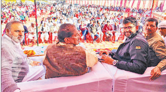
नारनौल। सम्मेलन में मौजूद जजपा नेता व कार्यकर्ता।

जननायक जनता पार्टी की ओर से दौंगड़ा अहीर चौक पर जिला युवा योद्धा सम्मेलन महायुवा योद्धा सम्मेलन बन गया। इसमें आए पार्टी के राष्ट्रीय अध्यक्ष डॉ. अजय सिंह चौटाला ने कहा कि आप लोगों के मेहनत की वजह से पार्टी के स्थापना दिवस पर आयोजित जौद जिले के जुलाना में आयोजित रैली की सफल हुई। चौटाला ने भारतीय