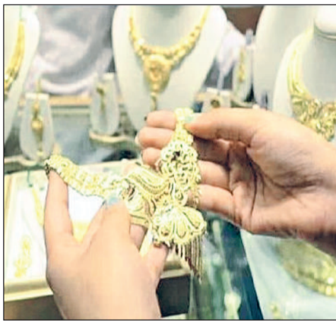
रेवाड़ी। शहर की एक ज्वेलरी शॉप में सजे सोने के आभूषण व शहर की एक ज्वेलरी शॉप में सजे चांदी के आइटम।

आमजन की पहुंच से दाम दूर हो चुके हैं, जिस कारण जेवरात बनवाने वाले लोग दामों में कमी आने का इंतजार कर रहे हैं।