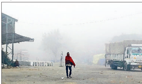
रेवाड़ी। सोमवार सुबह अनाजमंडी में छाया कोहरा व सोमवार को सरकुलर रोड से कोहरे में गुजरते वाहन।

गया। हवा में नमी का स्तर 76 प्रतिशत रहा, जबकि हवा की गति 8 किलोमीटर प्रति घंटा रही। दिन का तापमान अभी भी सामान्य से अधिक चल रहा है, जिससे लोगों को दिन के समय भारी सर्दी के प्रकोप का सामना अभी तक नहीं करना पड़ा है। गत वर्ष 29 दिसंबर को अधिकतम तापमान 14.0 डिग्री और न्यूनतम 11.0 डिग्री सेल्सियस दर्ज किया गया था। दिन-रात के तापमान में काफी कम अंतर रहने के कारण लोगों को कड़ाके की ठंड का सामना करना पड़ा था। इस बार दिसंबर माह में बारिश नहीं हुई है। गत वर्ष तीन बार हल्की बारिश ने मौसम ठंडा बना दिया था। मौसम विभाग के अनुसार अगले दो-तीन में मौसम में बदलाव आ सकता है। आसमान में बादल और बूंदबांदी होने की संभावना जताई जा रही है। इस दौरान तापमान में और गिरावट आने की संभावना है।