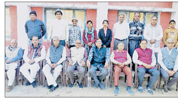
नारनौल। अरावली बचाने को एकजुट हुए हड़त में रह रहे बुद्धिजीवि।