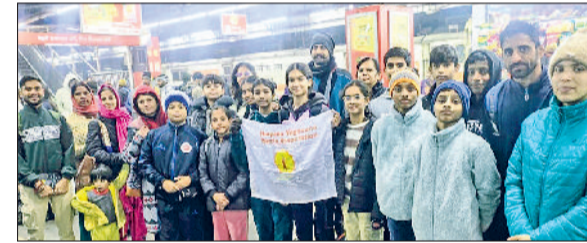
रेवाड़ी। राष्ट्रीय योगासन स्पोर्ट्स चैंपियनशिप के लिए महाराष्ट्र रवाना होते खिलाड़ी।