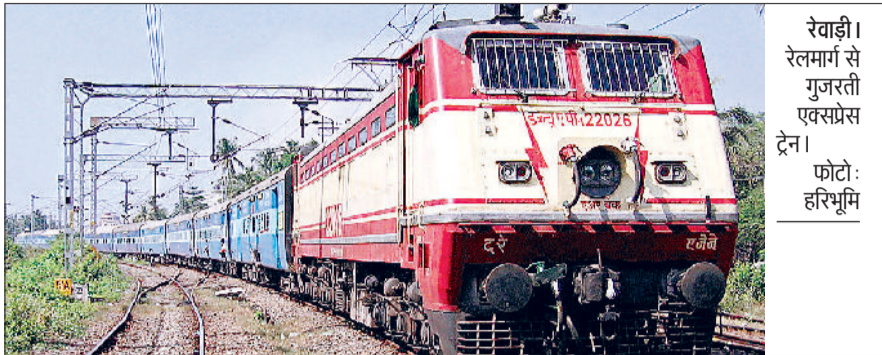
रेवाड़ी। रेलमार्ग से गुजरती एक्सप्रेस ट्रेन।

फरवरी तक 2 द्वितीय शयनयान श्रेणी डिब्बे, गाड़ी संख्या 19613/19612 अजमेर-अमृतसर-अजमेर रेलसेवा में अजमेर से 5 जनवरी से 28 जनवरी तक तथा अमृतसर से 6 जनवरी से 29 जनवरी तक 1 द्वितीय शयनयान श्रेणी डिब्बे, गाड़ी संख्या 19608/19607 मदार-कोलकाता-मदार एक्सप्रेस में मदार से 5 जनवरी से 26 जनवरी तक एवं कोलकाता से 8 से 29 जनवरी तक 1 सैकेड एसी श्रेणी डिब्बे, गाड़ी संख्या 12065/12066 अजमेर-दिल्ली सराय रोहिल्ला-अजमेर जन शताब्दी रेलसेवा में 2 जनवरी से 31 जनवरी तक 2 वातानुकूलित कुर्सीयान व 1 द्वितीय कुर्सीयान श्रेणी डिब्बे, गाड़ी संख्या 19701/19702 जयपुर-दिल्ली कैंट-जयपुर रेलसेवा में जयपुर से 1 जनवरी से 31 जनवरी तक तथा